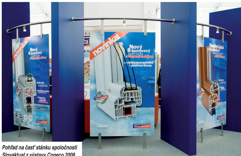
Pohľad na časť stánku spoločnosti Slovaktual z výstavy Coneco 2008.

Výsledok hodnotenia bol pre firmu Slovaktual priaznivý. Hodnotiacia komisia konštatovala, že okná z jej produkcie zodpovedajú všetkým hodnotiacim kritériám a zaslúžia si ocenenie. Profil a základná filozofia spoločnosti je založená na plnohodnotnom uspokojovaní všetkých požiadaviek zákazníkov. Vysoký počet obchodných zastúpení po území Slovenska pokrýva celé územie našej republiky.