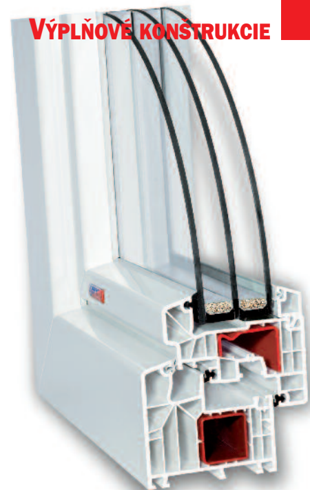
Slovaktual PASIV - HL.

Svojou stavebnou hĺbkou 85 mm a vlepým tepelnoizolačným trojsklom 4-18-4-18-4 mm je predurčené pre nízkoenergetické a pasívne domy. Súčiniteľ prechodu tepla celého okna U_w = 0,7 \text{ W/m}^2\text{K} .