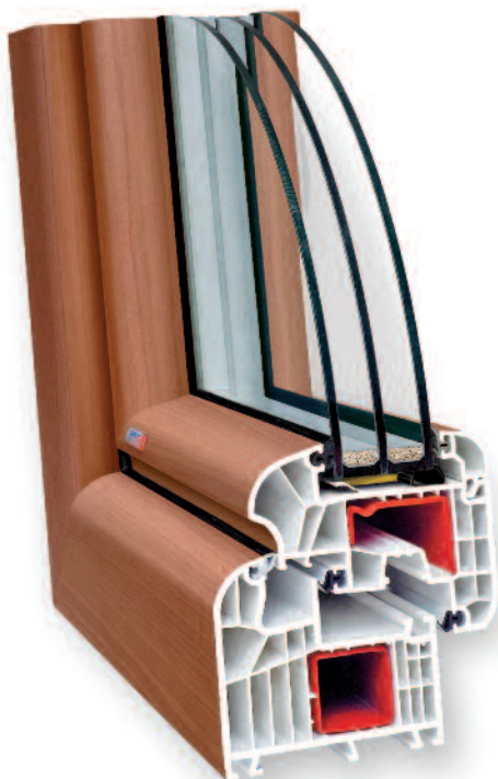
Slovaktual PASIV - OL farebné vyhotovenie. Stavebná hĺbka 85 mm s oblými líniami. Pri štandardnom zasklení 4-16-4-16-4 mm s U_g = 0,6 \text{ W/m}^2\text{K} dosahuje súčiniteľ prechodu tepla celého okna U_w = 0,8 \text{ W/m}^2\text{K} .

vedného správania. Zhoršujúci sa stav má nespočetne veľa dôsledkov, ktorých skutočný nepriaznivý dopad na životné prostredie a budúce pokolenia preverí len čas. Našťastie, väčšina z nás si to uvedomuje, čo v konečnom dôsledku vedie k znižovaniu negatívnych faktorov na životné prostredie. Ide napr. o znižovanie celkovej spotreby energií, zavádzanie nových šetrnejších technológií, zníženie emisie výfukových plynov, používanie úsporných elektrospotrebičov triedy AAA+ a mnoho ďalších foriem, ktoré vo finále chránia naše životné prostredie.