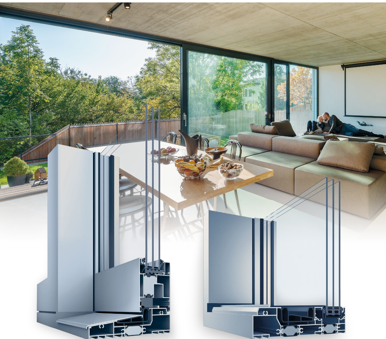
HST 77 HI